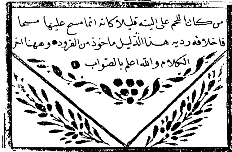
الصفحة الأخيرة من المخطوطة