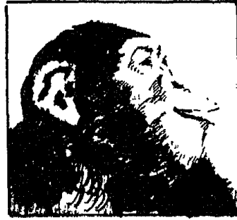
(شكل ٢) أثر الانفعال على الحيوان